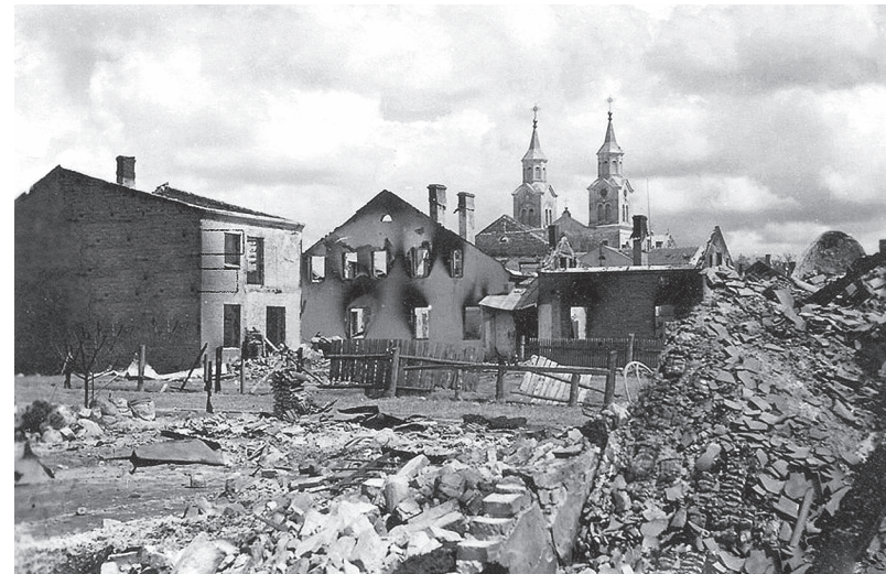
Pirmojo pasaulinio karo suniokotas Vilkaviškis