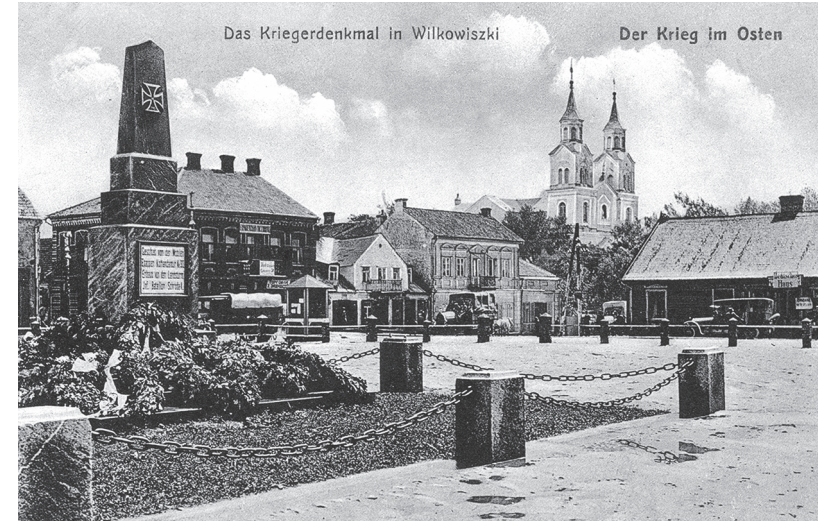
Vilkaviškio miesto centrinė aikštė. Pirmojo pasaulinio karo atvirukas Vilkaviškio rajono Suvalkijos (Sūduvos) kultūros centro-muziejaus rinkinys

Vilkaviškyje buvo didelė žydų sinagoga, kuri tuo laiku buvo vienas iš nuostabiausių medinės architektūros paminklų. Aukšta, su gontų stogais, ypatingo orientališko stiliaus, panaši į indų pagodas – maldyklas. Ji puošė gatvę ir sudarė puikų ansamblį su kitais senoviškais namais. Gaila, kad per Antrąjį pasaulinį karą sudegė, kaip ir visi aplinkiniai mediniai namai. Miestelio centre buvo sunaikinta didžiulė baltai dažyta katalikų katedra su dviem bokštais. Abu po pusantrą šimto metrų aukščio. Viename bokšte buvo varpai, antrame – bokštinis laikrodis, kurį apie 1906 metus specialiai iš Šveicarijos atvykęs laikrodininkas įmontavo ir kuris visą laiką gerai ėjo. Pavėjui toli būdavo girdėti, kaip tas laikrodis mušdavo valandas, pusvalandžius ir ketvirtis valandų. Daug mažesnė,